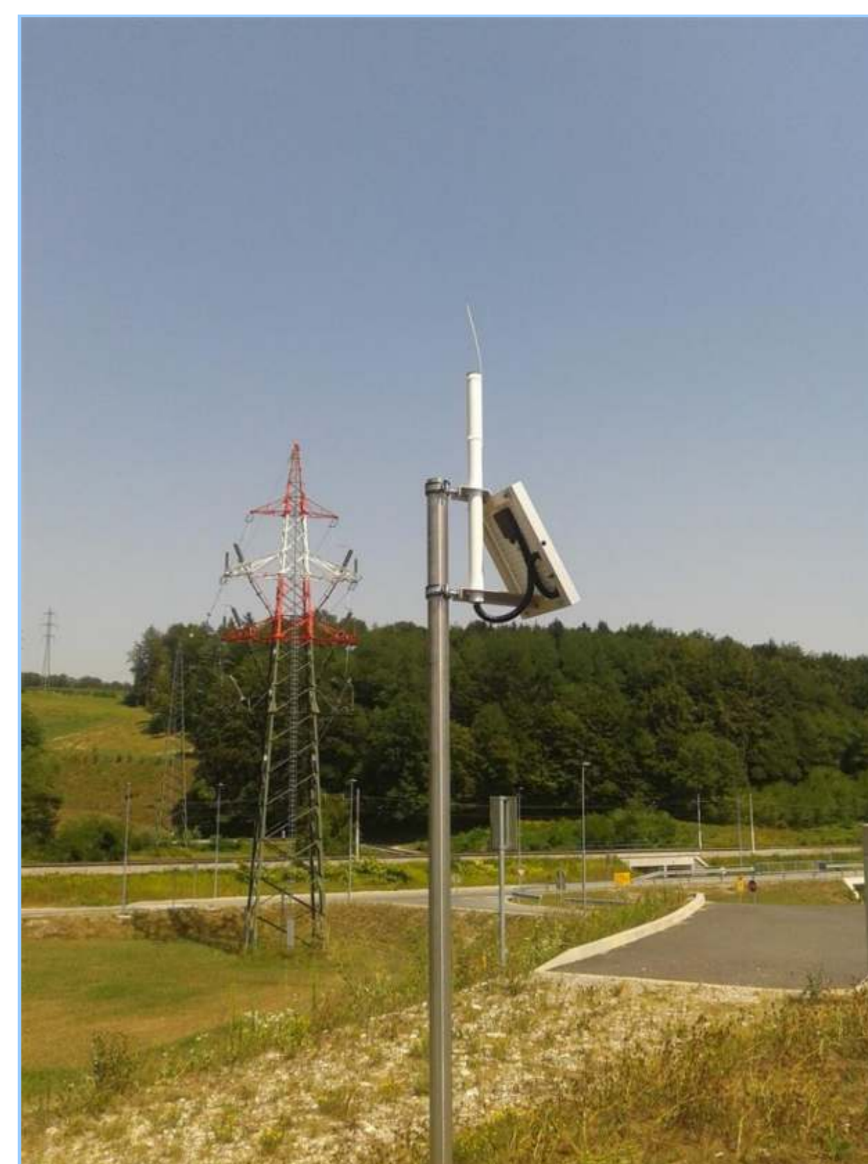
MEMO-REP Avtomatska relejna postaja